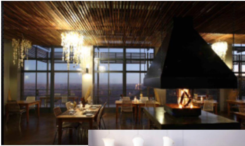
Fish River CanyonLodge