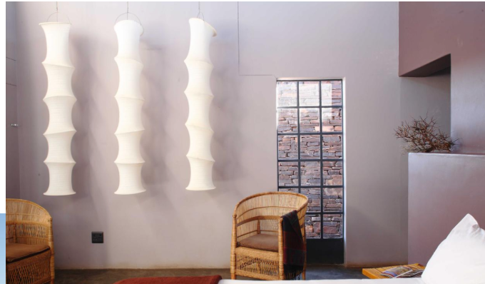
Fish River CanyonLodge